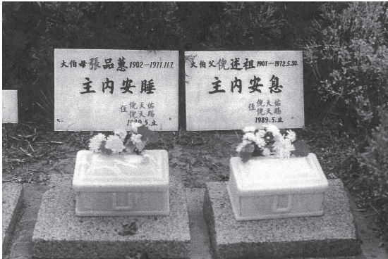
主僕倪柝聲及 師母之墓，安 葬於蘇州山上 公墓

1. 最後七封信都是舅父在1972年四、五月間寫給親人的。從七二年四月廿二日，五月六日，十六日，廿二日（二封信），廿六日，直到三十日。從這些信件，可見他一直期望與親人重聚，思念舅媽哀切情深，感人肺腑。（最後“七封信”是把四月末封信算在內，五月的六封信可見於拙著我的舅父倪柝聲增修版，金燈臺出版社）